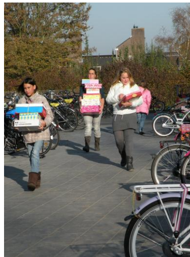
Groep 7 helpt mee om alle schoenendozen naar de bus te brengen