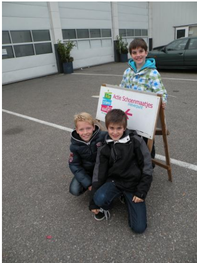
Kijk! Hier moeten we zijn.