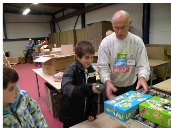
Natuurlijk mogen de reporters hun eigen schoenendoos scannen.