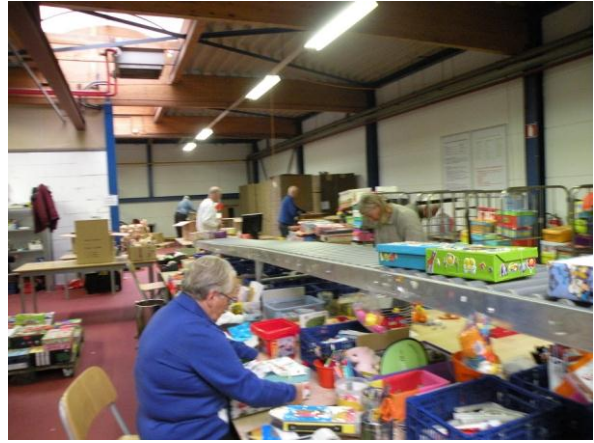
Op weg naar de volgende bestemming.