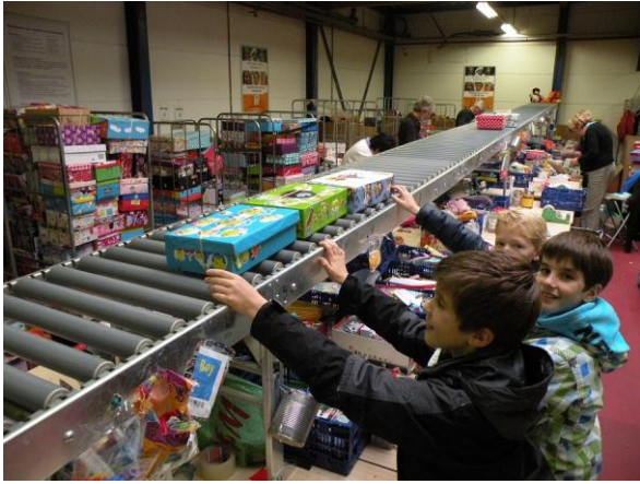
De schoenendozen zijn goedgekeurd en mogen dus op de lopende band worden gezet