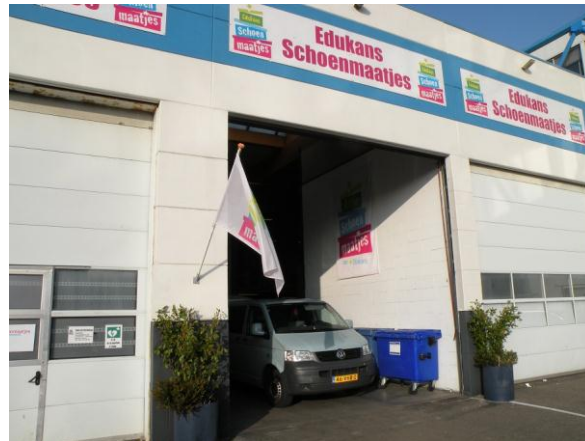
De dozen worden uitgeladen en de reporters gaan op pad..