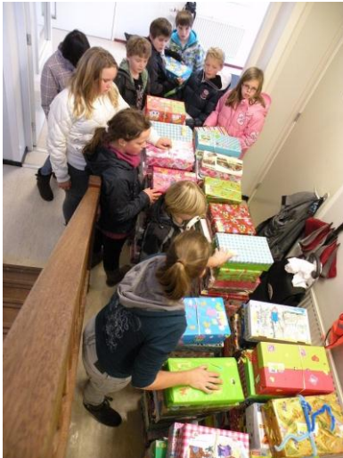
Alle dozen werden op school verzameld onder aan de trap