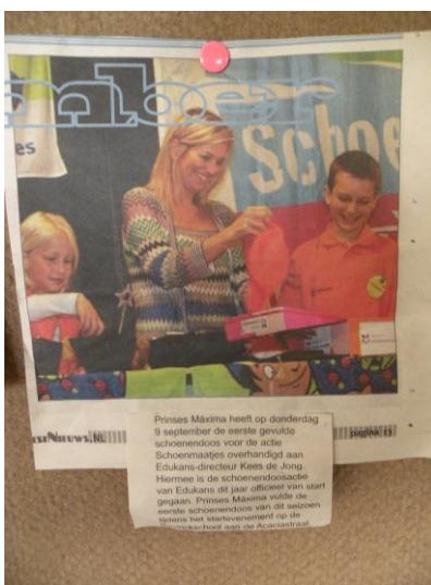
Zelfs Prinses Maxima doet mee met de schoendozenactie!