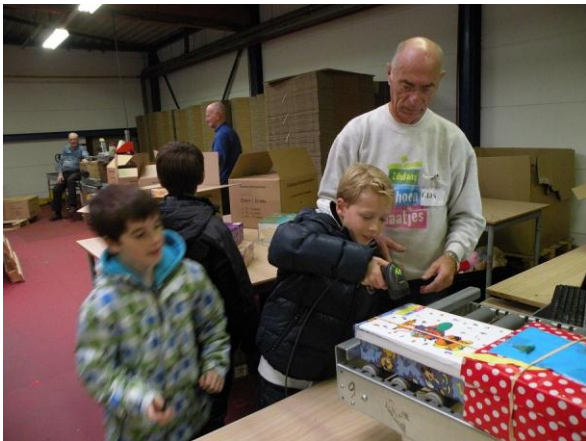
Aan het eind van de band worden de schoenendozen gescand. Het scanapparaat gaat dan over de sticker die iedereen op de schoenendoos heeft geplakt. Zo weten ze bij Edukans precies naar welk land de schoenendoos gaat.