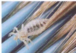
Hoofdluis op een kam.

Combineer het kammen eventueel met een antihoofdluismiddel en herhaal de gecombineerde behandeling na 7 dagen. Bij het kammen kunt u dan een luizenkam gebruiken in plaats van een netenkam.